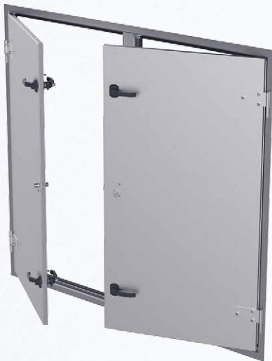
With removable centre bar Mit demontierbarem Mittelsteg