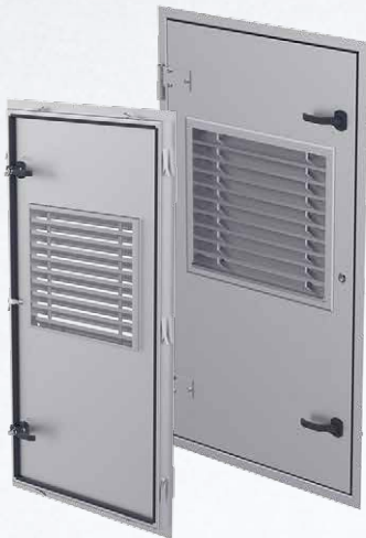
With weather louvre and wall chasers Mit Wetterschutzgitter und Mauerschlaudern