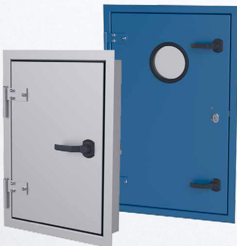
With 100 mm insulation Mit 100 mm Isolation